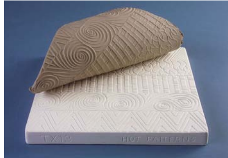
TX 13 - Hot Patterns