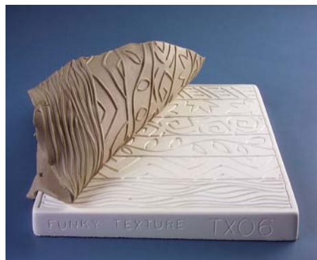
TX 06 - Funky