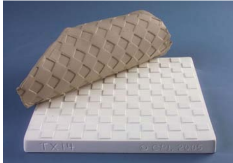
TX 14 - Squares