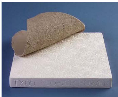
TX 09 - Flower Power