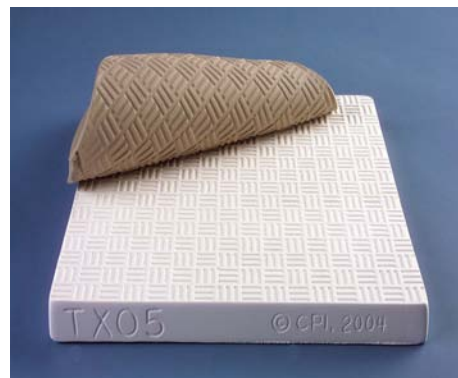
TX 05 - Geo Grid