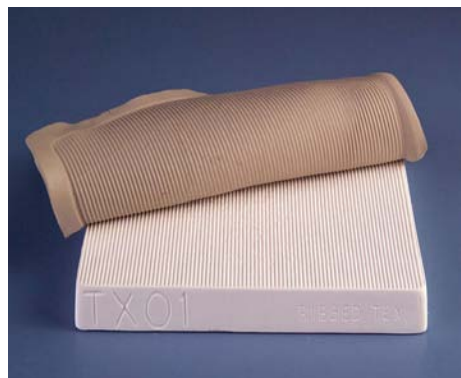
TX 01 - Ribbed

Gips Strukturen eignen sich als Unterlage zum Eindrücken von Tonmassen. Daraus ergeben sich vielfältige, interessante, strukturierte Oberflächen, die in den verschiedensten Objektkeramiken eingesetzt werden können.