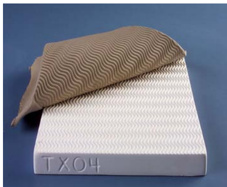
TX 04 - Wave